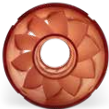
Figure 4 耐高温材料的热变形温度高达 300°C,无需额外的热固化后处理,在极限条件下具有极高刚性和出色的稳定性。