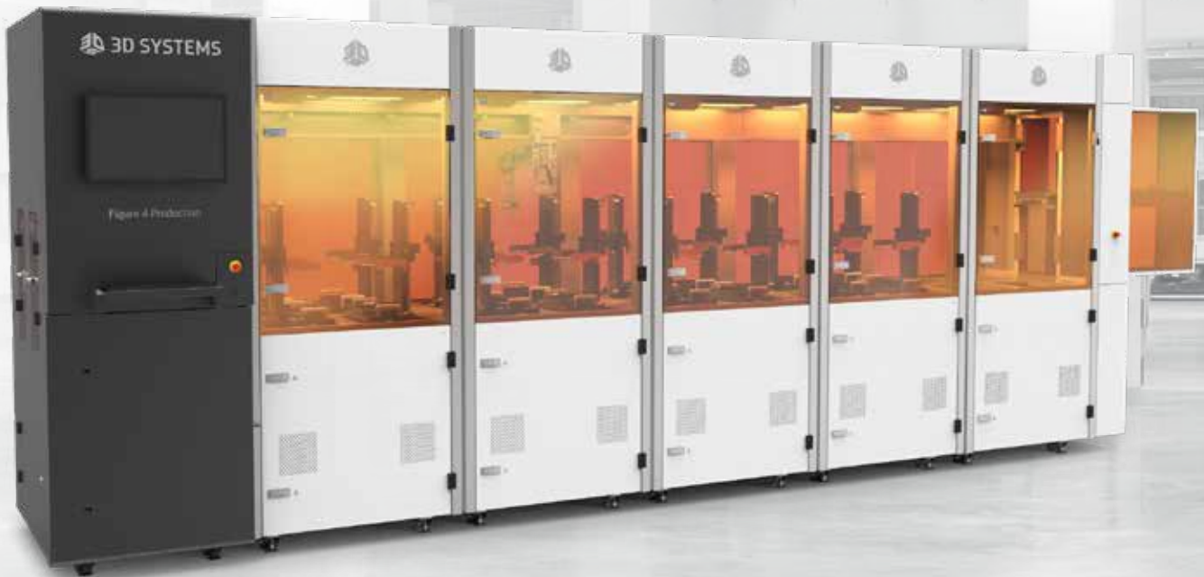
Figure 4 Production 将增材制造的设计灵活性与可配置的在线生产模块相结合, 以提供可定制和自动化的直接 3D 生产解决方案。