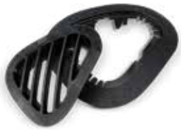
Figure 4 刚性材料可生产外观和质感与铸造聚氨酯或注塑成型部件一般无二的耐用塑料部件,这些部件的特点包括打印速度快、伸长率高、抗冲击强度优异、耐湿/防潮性好以及长期环境稳定性等。