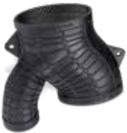
Figure 4 弹性材料是生产具有出色形状复原能力和高撕裂强度的功能性类橡胶部件的理想之选,非常适用于压缩形变类应用和有材料延展性要求的应用