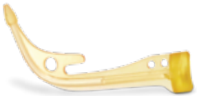
Figure 4 Production 与 3D Systems 的整个 NextDent® 材料产品组合兼容,有助于简化牙科装置的完全定制。您还可从 Figure 4 的特殊材料中进行选择,用于牺牲模具加工、珠宝铸造、需要生物相容性和/或灭菌的医疗应用等等。